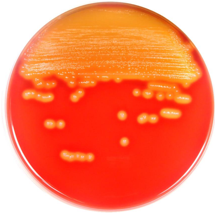
Streptococcus pyogenes ATCC 19615